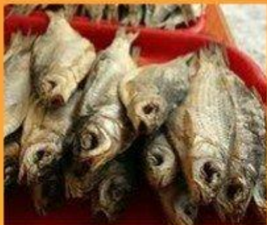
Сушёная рыба (Исландия)