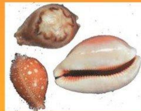
Раковины Каури (Приморье)