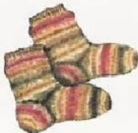
30 тёплые носки