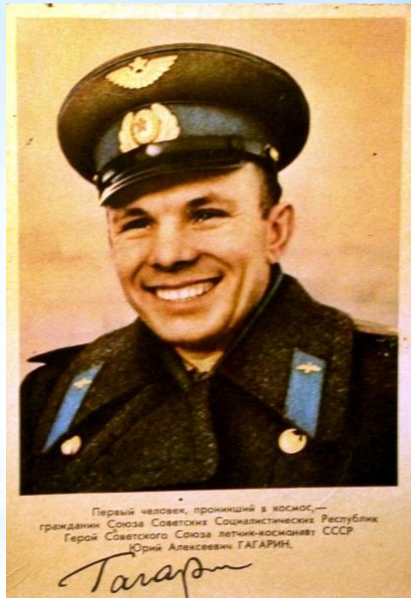
Первый человек, проникший в космос, — гражданин Союза Советских Социалистических Республик Герой Советского Союза летчик-космонавт СССР Юрий Алексеевич ГАГАРИН.

Не попросив подмог ни у кого, Сама восстав из пепла и из праха, Моя страна, не знающая страха, Шлет в космос ныне сына своего.