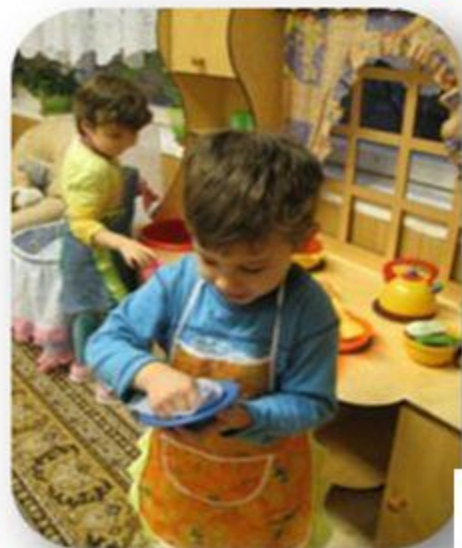
Хозяйственно- бытовой труд