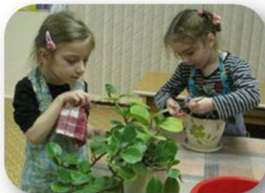
Труд в природе