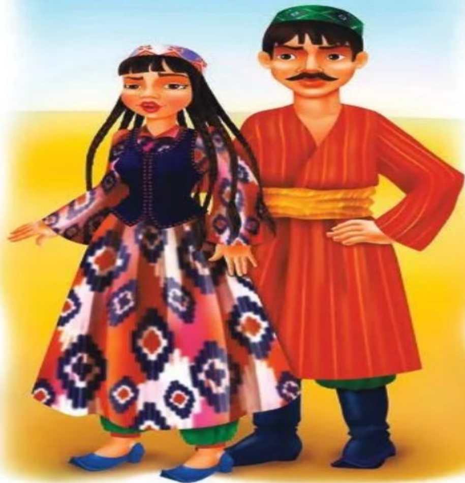
УЗБЕКИ (УЗБЕКИСТАН, СРЕДНЯЯ АЗИЯ)