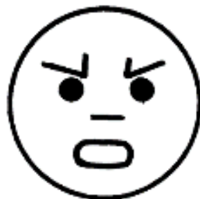
ГНЕВ ( ЗЛОСТЬ )