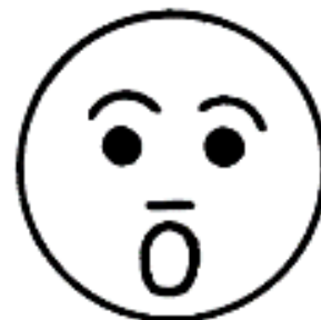
УДИВЛЕНИЕ ( ИЗУМЛЕНИЕ )