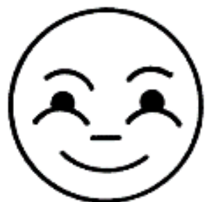
РАДОСТЬ ( ВЕСЕЛЬЕ )