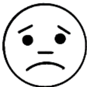
ГРУСТЬ ( ПЕЧАЛЬ )