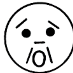
СТРАХ ( УЖАС )